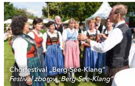
Chorfestival „Berg-See-Klang“ Festival zborov „Berg-See-Klang“