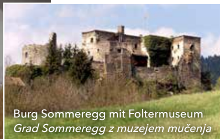
Burg Sommeregg mit Foltermuseum Grad Sommeregg z muzejem mučenja