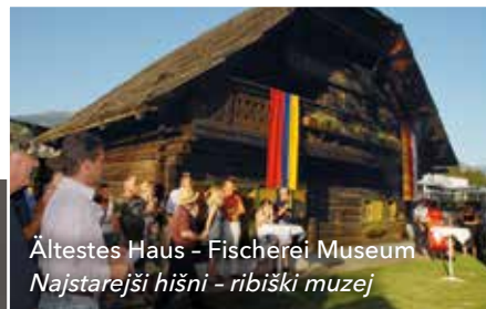
Ältestes Haus - Fischerei Museum Najstarejši hišni - ribiški muzej