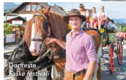
Dorffeste Faške festivali