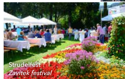
Strudelfest Zavitek festival