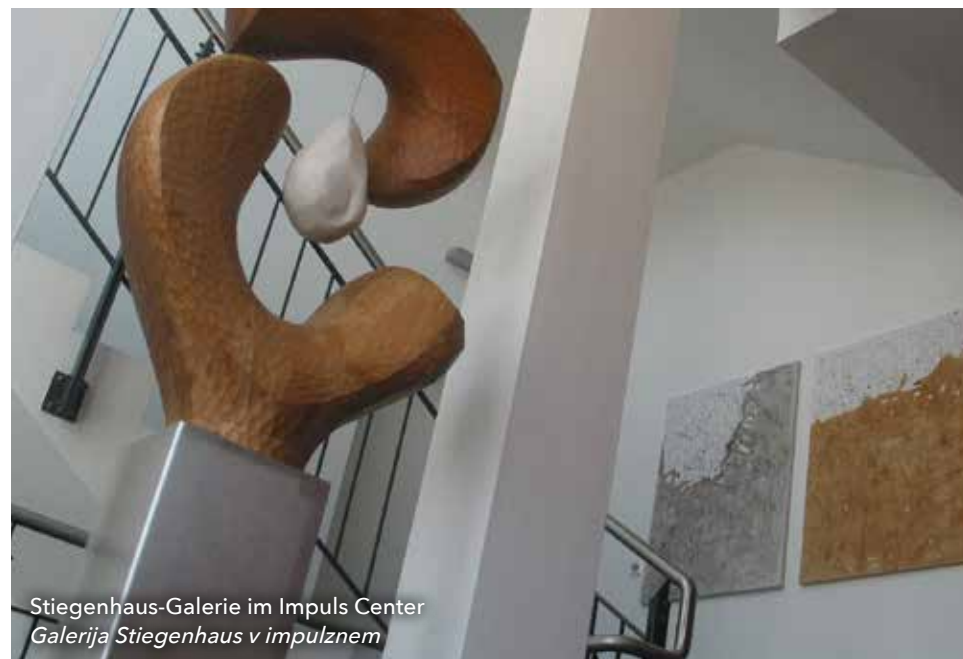
Stiegenhaus-Galerie im Impuls Center Galerija Stiegenhaus v impulznem