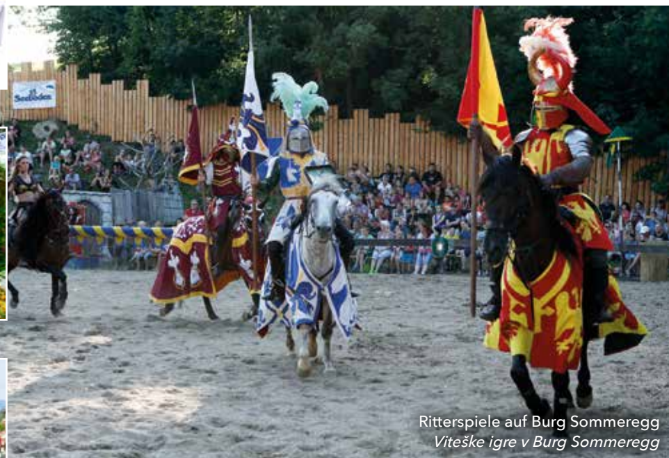
Ritterspiele auf Burg Sommeregg Viteške igre v Burg Sommeregg