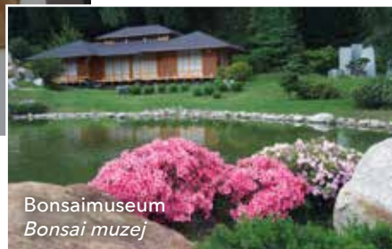
Bonsaimuseum Bonsai muzej